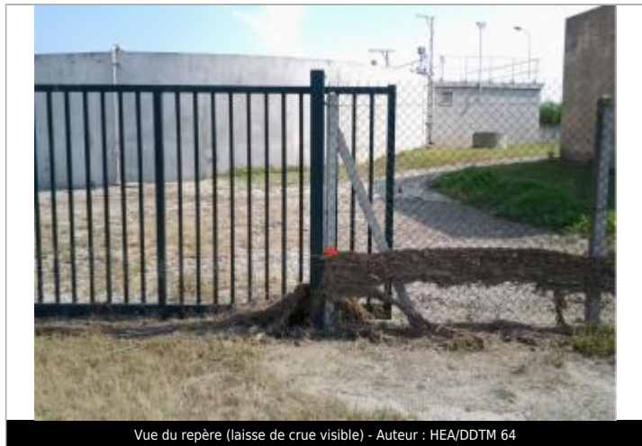
Vue du repère (laisse de crue visible)

Type de repérage : Campagne de terrain post-inondation