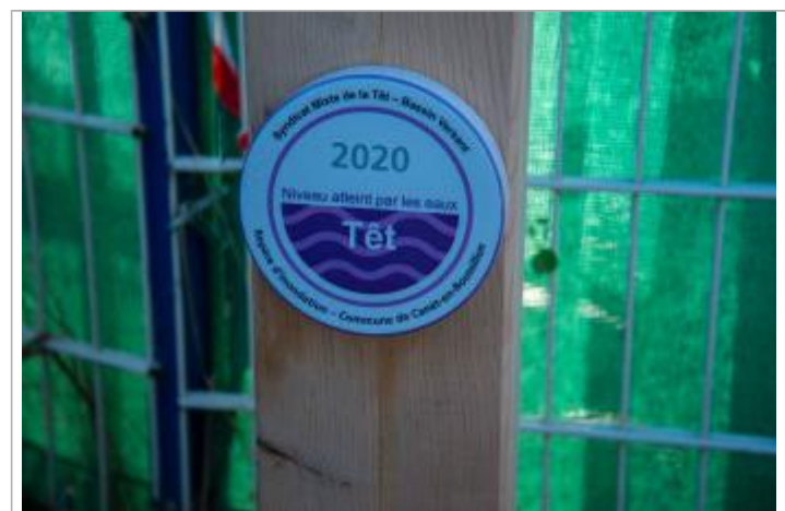
Repère de crue sur totem