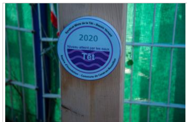
Repère de crue sur totem