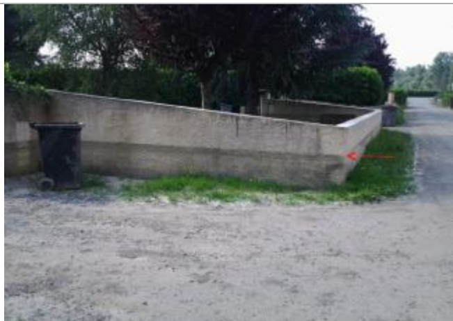
Vue du repère (la flèche représente le niveau atteint par les eaux)

Type de repérage : Campagne de terrain post-inondation