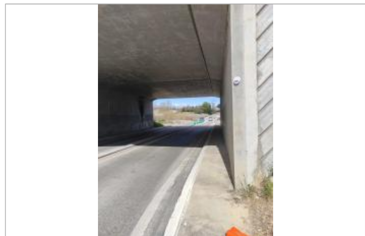
Repère de crue, Gloria janvier 2020