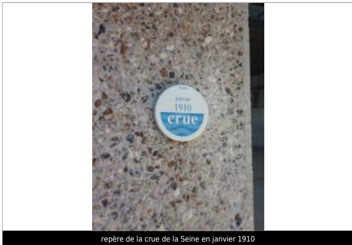
repère de la crue de la Seine en janvier 1910