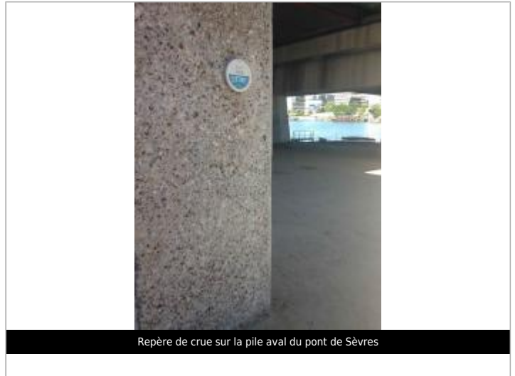
Repère de crue sur la pile aval du pont de Sèvres