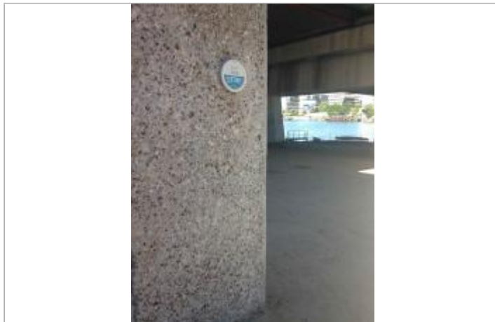
Repère de crue sur la pile aval du pont de Sèvres