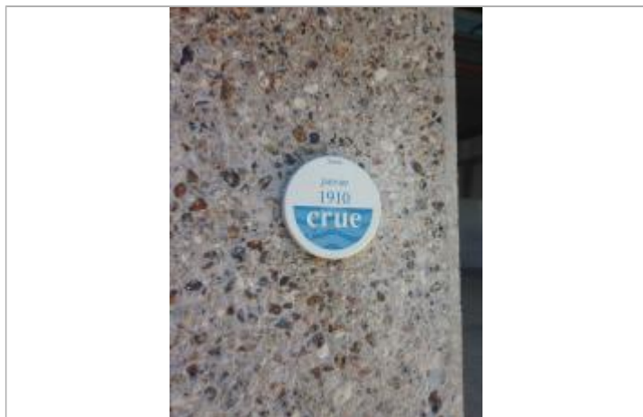
repère de la crue de la Seine en janvier 1910