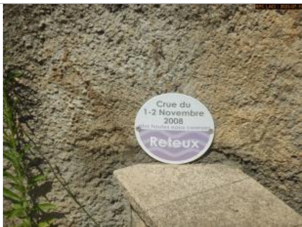
Vue du repère en 2023

Altitude calculée de l'eau (en m) : 452.34