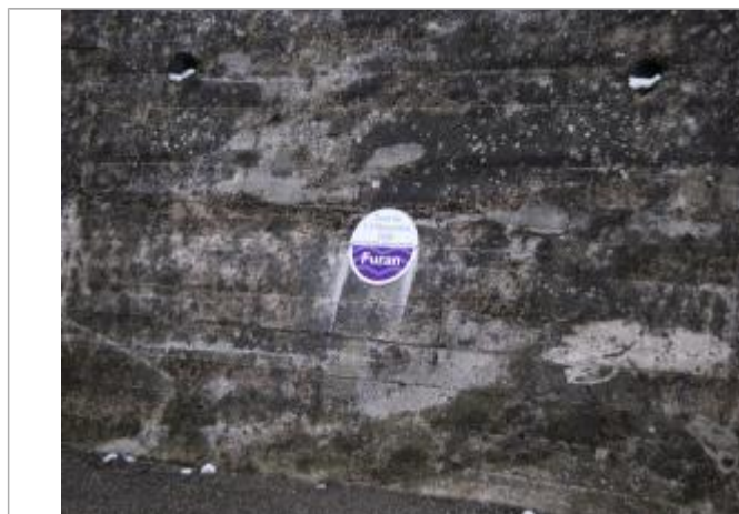
Vue rapprochée du repère en 2022

Texte : Plus hautes eaux connues, crue du 1-2 novembre 2008, Le Furan Maximum de l'inondation : Oui Visibilité : Oui État du repère : Bon Pérennité : Longue