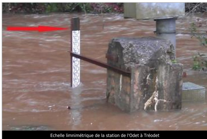
Echelle limnimétrique de la station de l'Odet à Tréodet

Code : SPC 29501_03_2000 Date de mise à jour : 01/03/2022 Auteur : SPC VCB