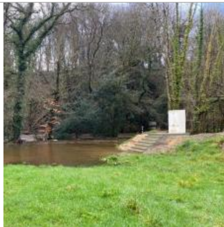
Station limnimétrique de l'Odet à Tréodet