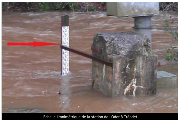
Echelle limnimétrique de la station de l'Odet à Tréodet