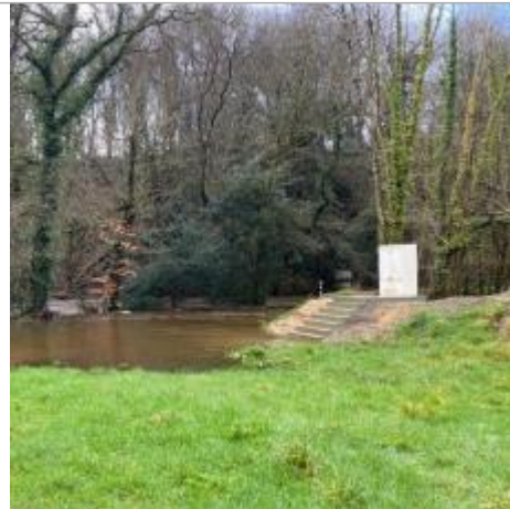
Station limnimétrique de l'Odet à Tréodet

Coordonnées WGS84 : X: -4.06393940 / Y: 48.00634400