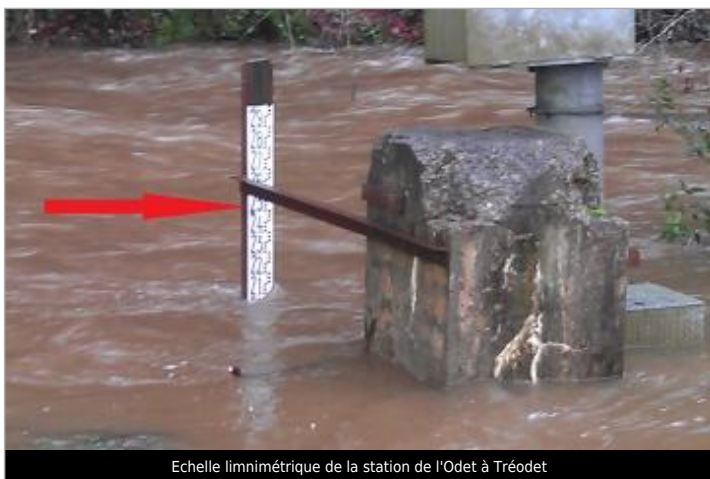
Echelle limnimétrique de la station de l'Odet à Tréodet

Altitude calculée de l'eau (en m) : 10.69 m