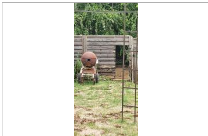
Laisse sur le 4ème barreau horizontal

Texte : Laisse sur le 4ème barreau horizontal Maximum de l'inondation : Oui Visibilité : Oui État du repère : Bon Pérennité : Aucune