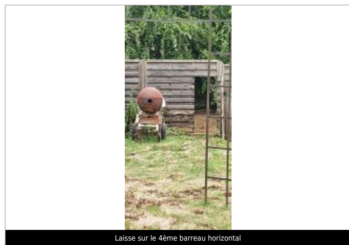
Laisse sur le 4ème barreau horizontal