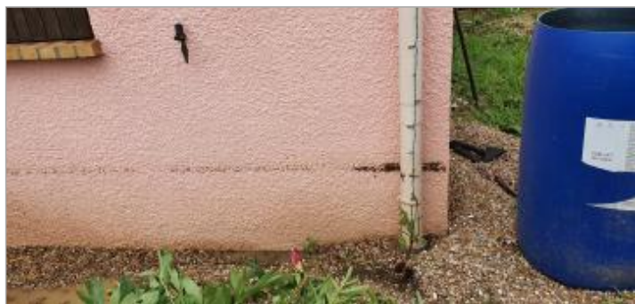
Laisse de crue sur mur à 30 cm/sol.

SOURCE DE REPÉRAGE : VISITE DE TERRAIN SPC SACN - 11/03/2020