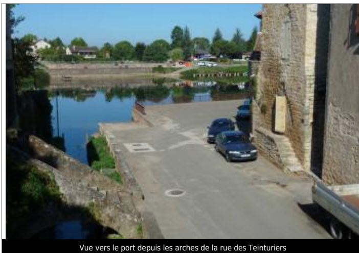
Vue vers le port depuis les arches de la rue des Teinturiers