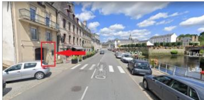
Quai Brizeux et confluence Ellé-Isole-Laïta

Coordonnées WGS84 : X: -3.54569250 / Y: 47.87061900