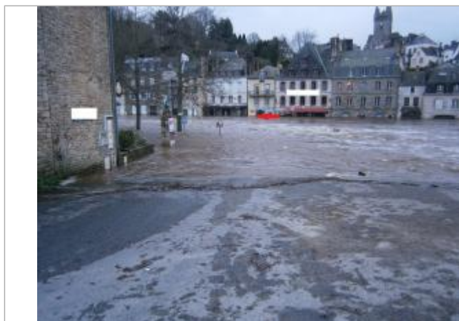
Photographie prise au maximum de la crue

Altitude calculée de l'eau (en m) : 4.86 m