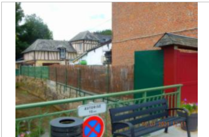
Mur sur façade de maison au n°12 Rue Grande.