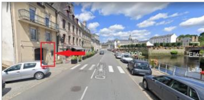
Quai Brizeux et confluence Ellé-Isole-Laïta