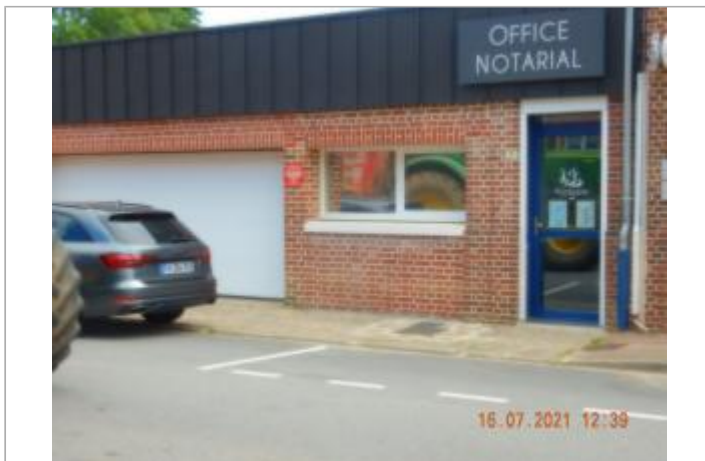
Office Notarial au 7 rue Grande.