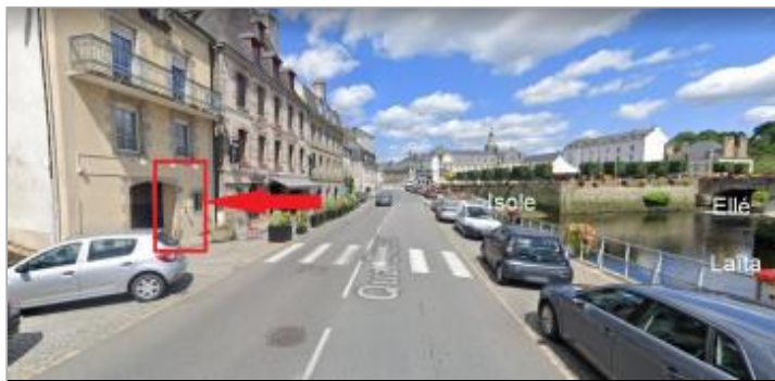
Quai Brizeux et confluence Ellé-Isole-Laïta

GÉOLOCALISATION Coordonnées WGS84 : X: -3.54569250 / Y: 47.87061900 Coordonnées RGF93 (Lambert 93) X: 211193.46 / Y: 6772518.9 Coordonnées RGF93 (ETRS89) : X: -3.5456925 / Y: 47.870619 Code Hydro: _ELAITA_ Rive de référence: Droite