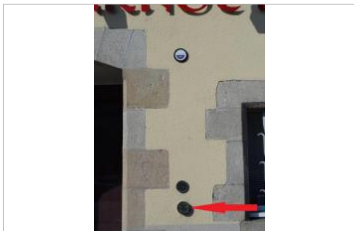
Plaque de la crue du 4 janvier 1925

Altitude calculée de l'eau (en m) : 4.51 m