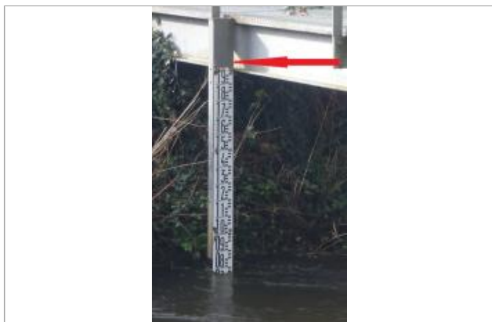
Echelle limnimétrique du Jet à Ergué-Gabéric (Kerjean)