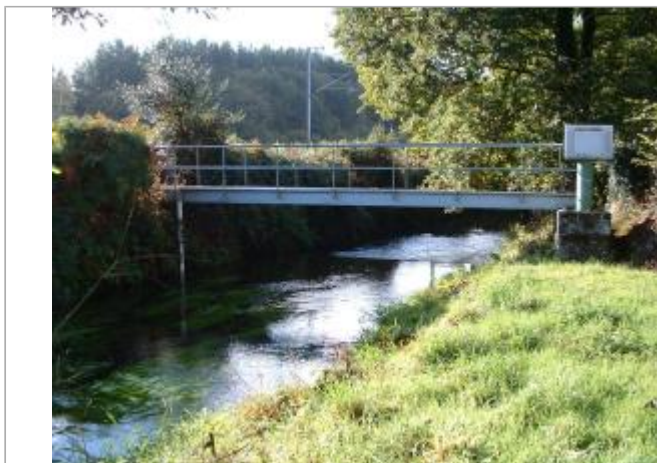
Station limnimétrique du Jet à Ergué-Gabéric (Kerjean)