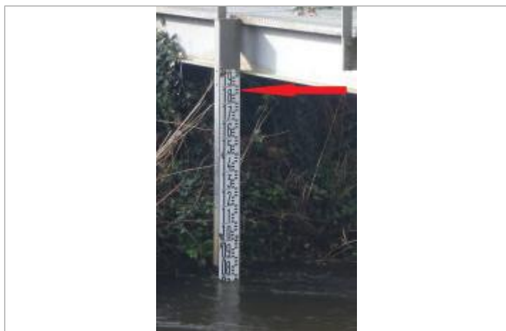
Echelle limnimétrique du Jet à Ergué-Gabéric (Kerjean)

Code : SPC 29501_02_1994 Date de mise à jour : 28/02/2022 Auteur : SPC VCB