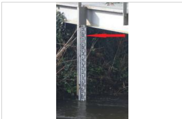
Echelle limnimétrique du Jet à Ergué-Gabéric (Kerjean)

Altitude calculée de l'eau (en m) : 20.54 m