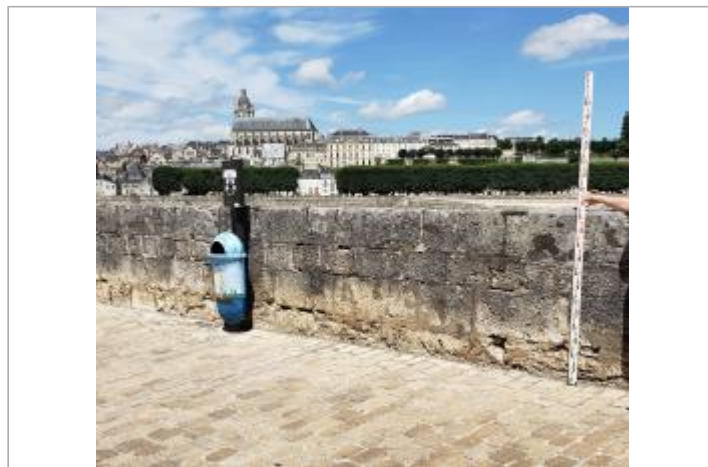
Vue du site en 2022

GÉOLOCALISATION Coordonnées WGS84 : X: 1.34228390 / Y: 47.58566100 Coordonnées RGF93 (Lambert 93) X: 575410.89 / Y: 6721894.91 Coordonnées RGF93 (ETRS89) : X: 1.3422839 / Y: 47.585661 Code Hydro: ----0000 Rive de référence: Droite