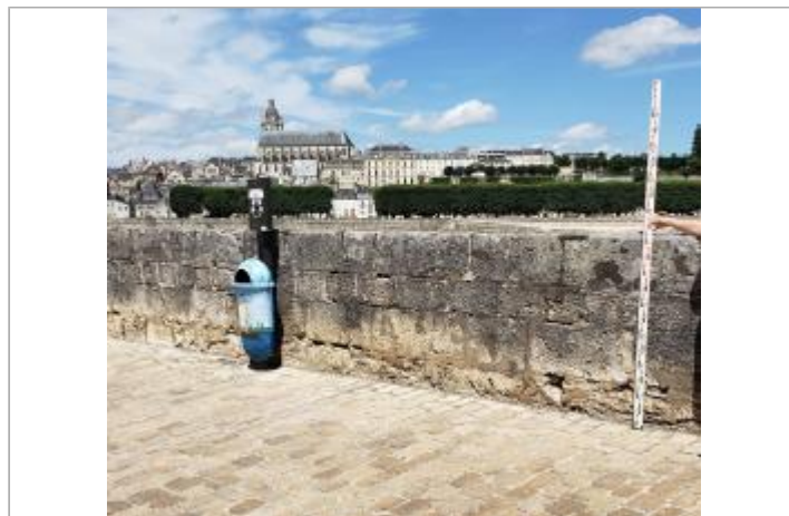
Vue du site en 2022