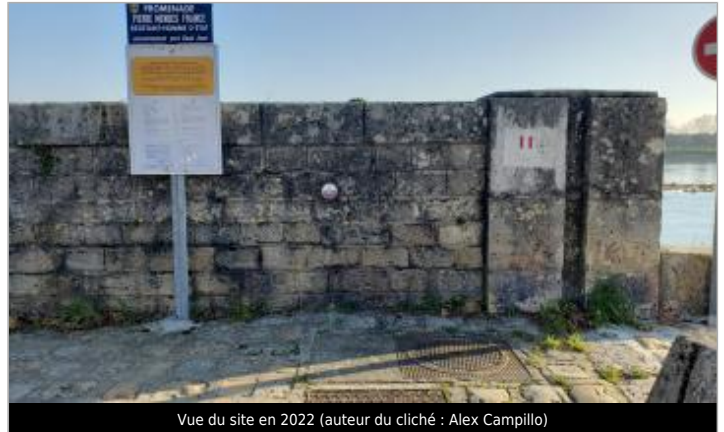
Vue du site en 2022