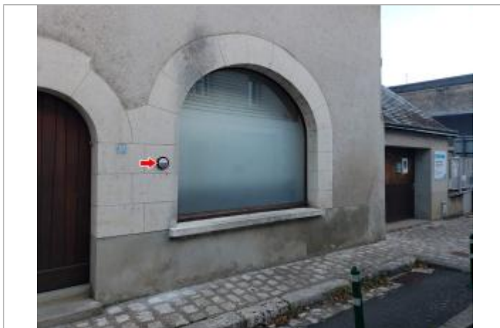
Vue du site en 2022