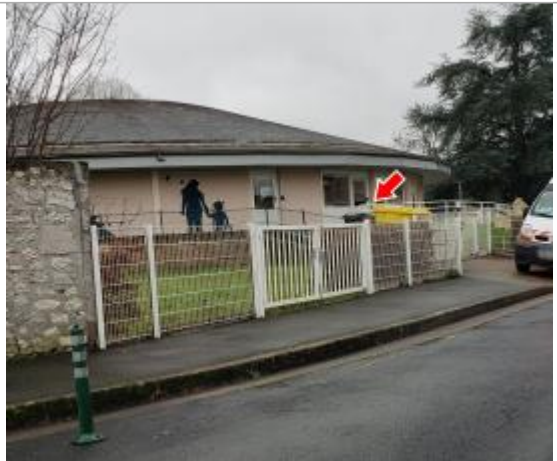
Vue du site en 2022