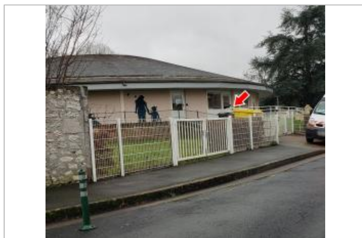
Vue du site en 2022

GÉOLOCALISATION Coordonnées WGS84 : X: 1.34354830 / Y: 47.58325800 Coordonnées RGF93 (Lambert 93) X: 575500.3 / Y: 6721626.01 Coordonnées RGF93 (ETRS89) : X: 1.3435483 / Y: 47.583258 Code Hydro: ----0000 Rive de référence: Gauche