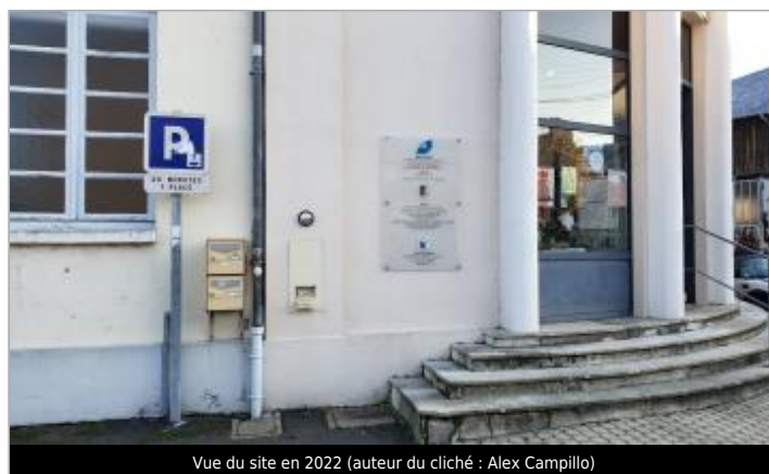
Vue du site en 2022

GÉOLOCALISATION Coordonnées WGS84 : X: 1.34351070 / Y: 47.58167600 Coordonnées RGF93 (Lambert 93) X: 575493.79 / Y: 6721450.35 Coordonnées RGF93 (ETRS89) : X: 1.3435107 / Y: 47.581676 Code Hydro : ----0000 Rive de référence : Gauche