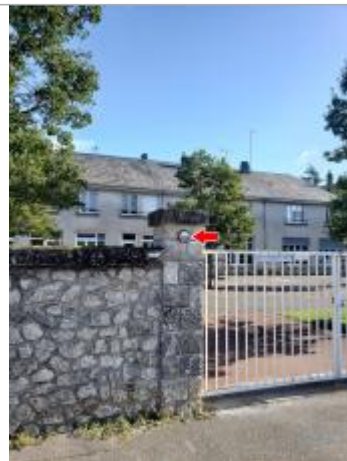
Vue du site en 2022