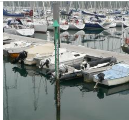
Echelle marégraphique au port de Bénodet