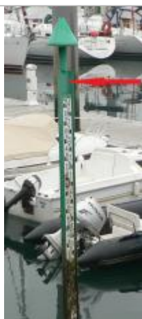
Echelle marégraphique du port de Bénodet

Altitude calculée de l'eau (en m) : 3.61 m