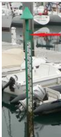
Echelle marégraphique du port de Bénodet

Altitude calculée de l'eau (en m) : 3.61 m