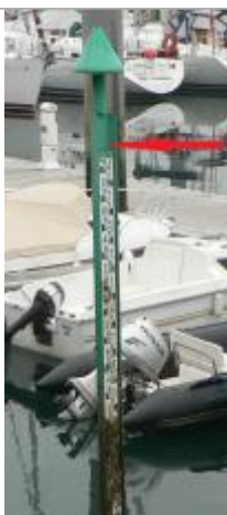
Echelle marégraphique du port de Bénodet

Altitude calculée de l'eau (en m) : 3.52 m