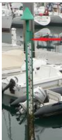
Echelle marégraphique du port de Bénodet

Altitude calculée de l'eau (en m) : 3.52 m