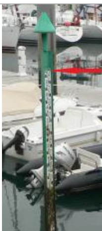
Echelle marégraphique du port de Bénodet

Altitude calculée de l'eau (en m) : 3.44 m