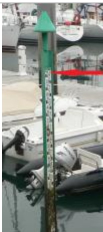
Echelle marégraphique du port de Bénodet

Altitude calculée de l'eau (en m) : 3.4 m