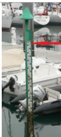
Echelle marégraphique du port de Bénodet

Altitude calculée de l'eau (en m) : 3.4 m