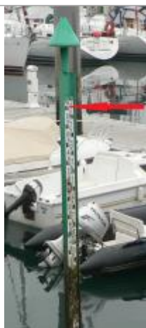
Echelle marégraphique du port de Bénodet

Altitude calculée de l'eau (en m) : 3.38 m