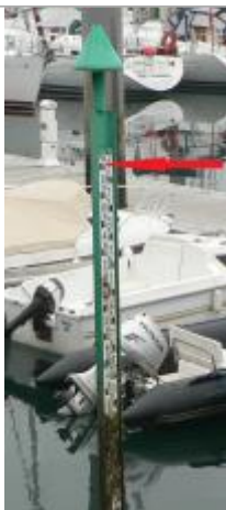
Echelle marégraphique du port de Bénodet

Altitude calculée de l'eau (en m) : 3.38 m