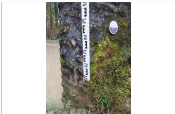
Photo du repère - SPC SMYL