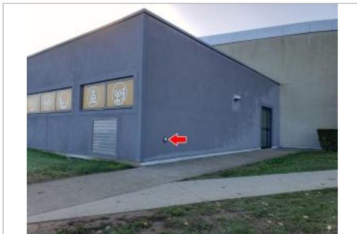
Vue du site en 2022