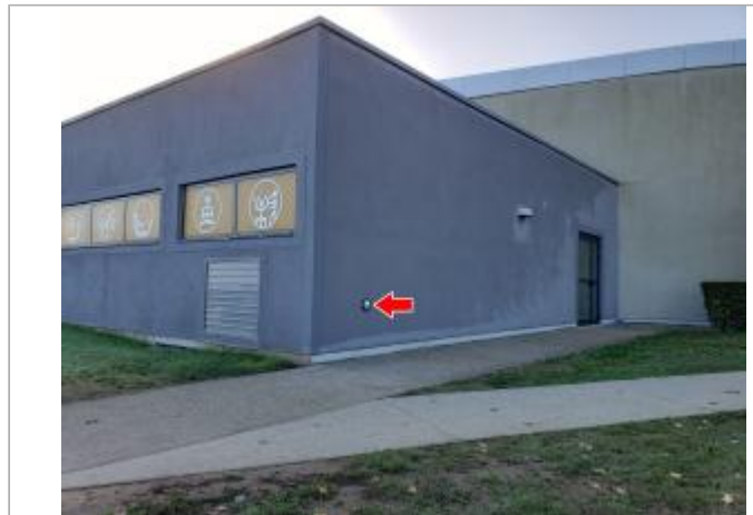
Vue du site en 2022