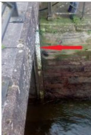
Echelle fluvio-marégraphique de l'Odet au palais de justice à Quimper

Altitude calculée de l'eau (en m) : 3.655 m