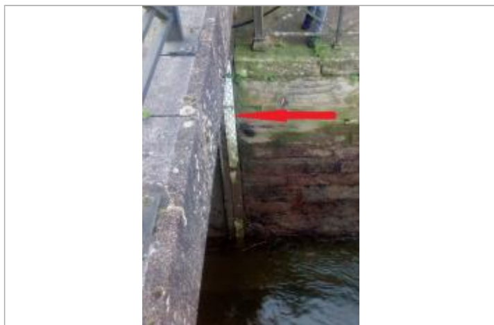
Echelle fluvi-marégraphique de l'Odet au palais de justice à Quimper

Altitude calculée de l'eau (en m) : 3.655 m