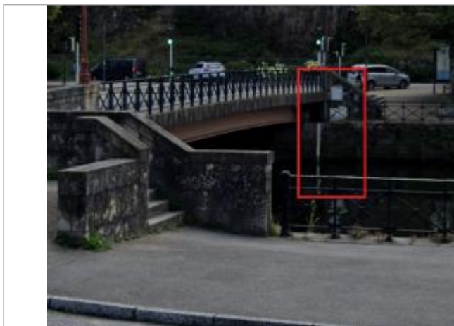
Station fluvi-marégraphique du palais de justice à Quimper