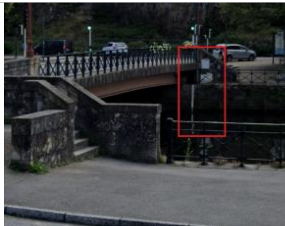
Station fluvi-marégraphique du palais de justice à Quimper