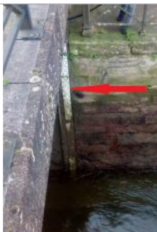
Echelle fluvi-marégraphique de l'Odet au palais de justice à Quimper

Altitude calculée de l'eau (en m) : 3.535 m