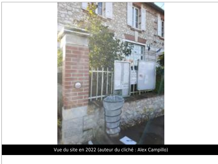
Vue du site en 2022