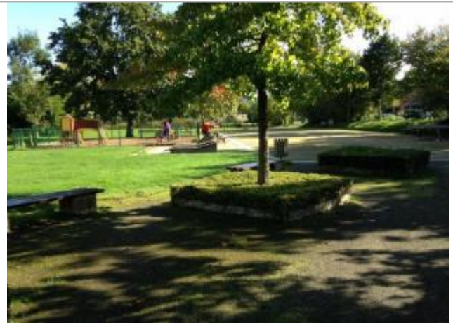
Aire de jeux pour enfant