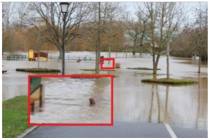
Niveau d'eau déduit de la photographie (incertitude de 5cm)

Altitude calculée de l'eau (en m) : 34.361