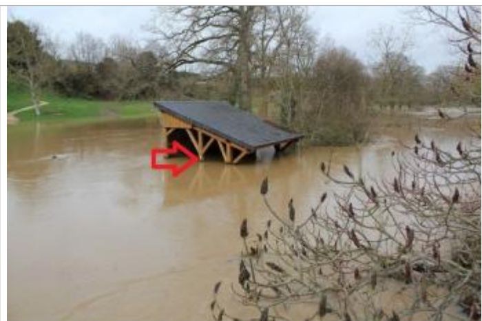
niveau d'eau en-dessous des arches du lavoir

Altitude calculée de l'eau (en m) : 34.35 m