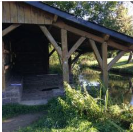
Lavoir sur le Garun rue des Arcades