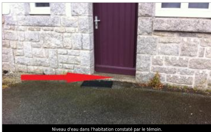
Niveau d'eau dans l'habitation constaté par le témoin.