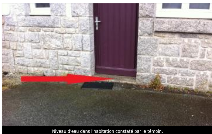
Niveau d'eau dans l'habitation constaté par le témoin.