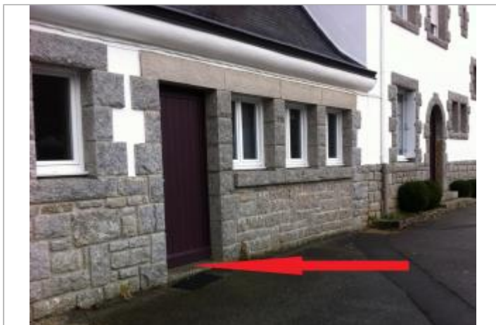
Bâtiment au 11 quai Emile Baley