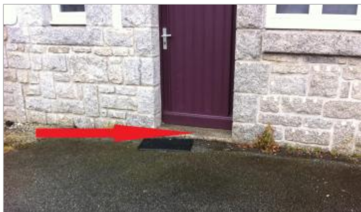
Niveau d'eau dans l'habitation constaté par le témoin.

SOURCE DE REPÉRAGE : CAMPAGNE DE TERRAIN DHE 2015 - 26/02/2015