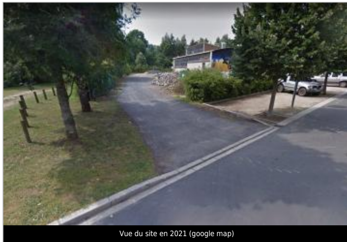
Vue du site en 2021