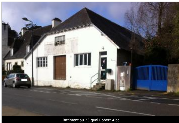
Bâtiment au 23 quai Robert Alba