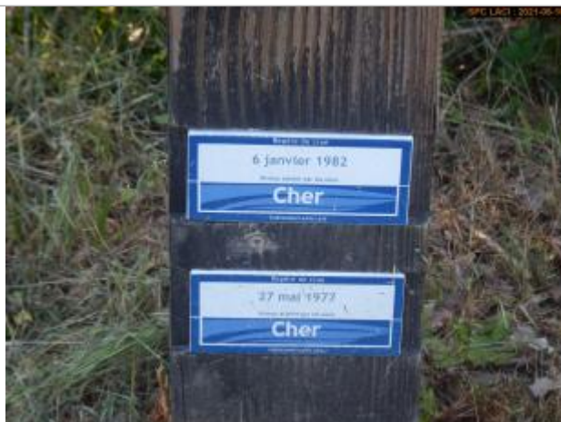
Vue du repère rapprochée en 2021