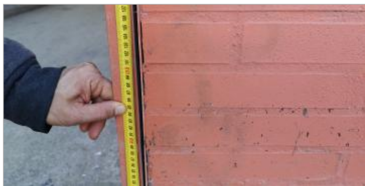
Vue du repère